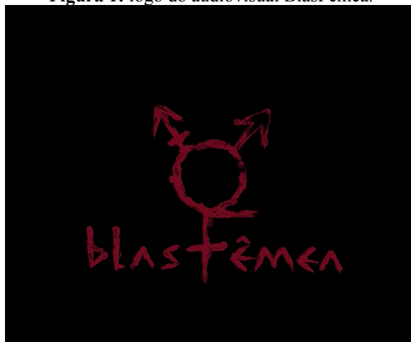
Figura 1: logo do audiovisual BlasFêmea.

As caravanas de mulheres se unem no cruzamento de uma esquina. É possível ver a diversidade de mulheres: há mulheres cisgênero, mulheres trans e indivíduos que borram as fronteiras de identidade de gênero. As cenas de violência contra Linn se intensificam e agora conseguimos melhor enxergar os rostos de seus agressores que passam a ser cercados pelas mulheres que, com fúria, os atacam. Não vemos o que acontece posteriormente com os homens, pois agora são retomadas as cenas de Linn da Quebrada, andando solitária pelas ruas até o fim da canção, quando entra o logo blasFêmea (figura 1), feito a partir do símbolo que representa as pessoas trans.