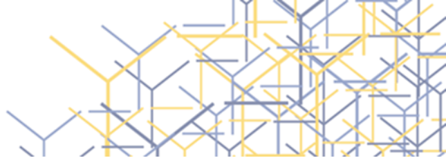
Ilustração 1 - Circuito de Cultura